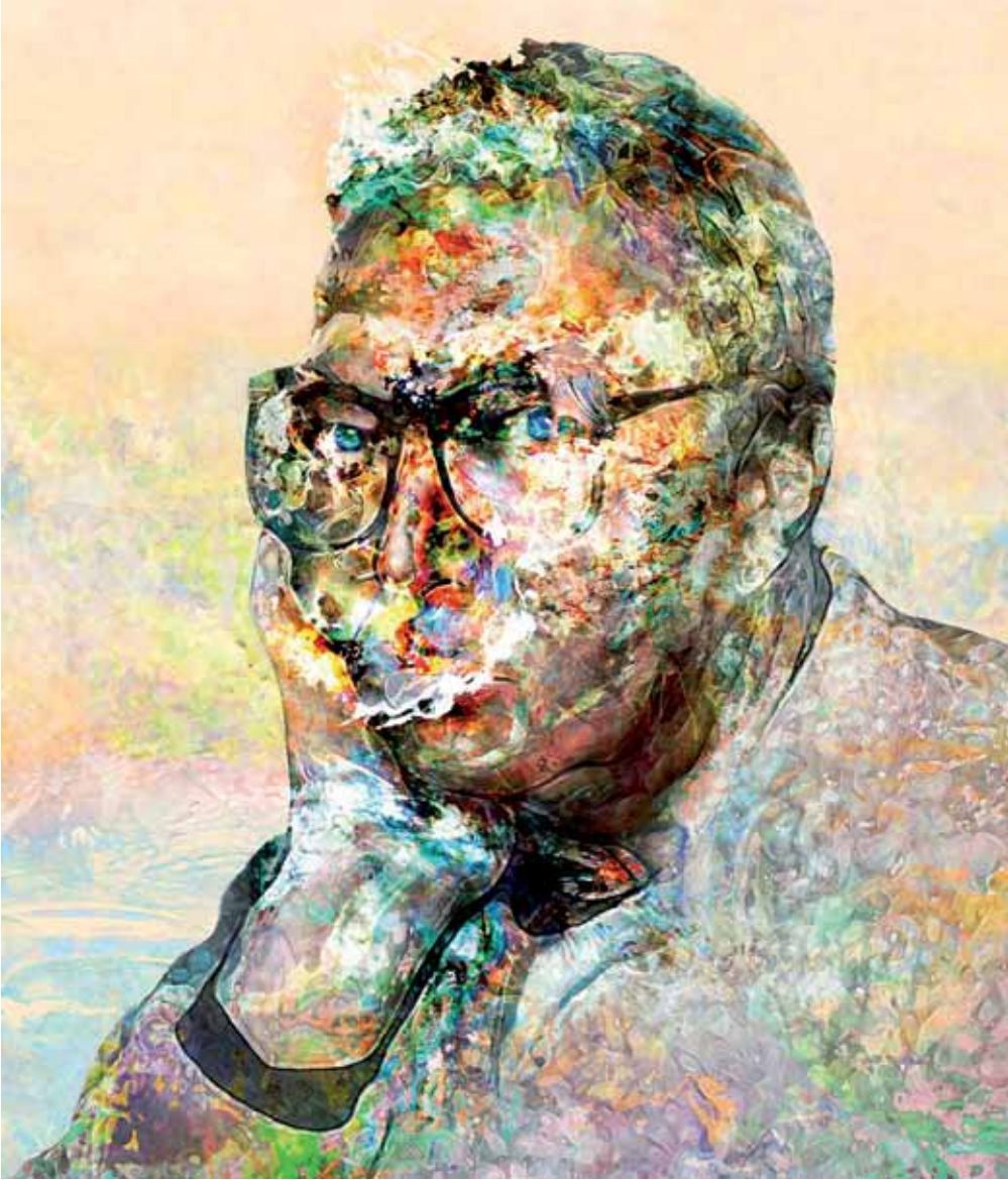
Makoto Saito Portrait JJ, 2009 acrylic paint and oil ink on canvas with supported panel 187.5x158cm, 73 7/8x62 1/4in.