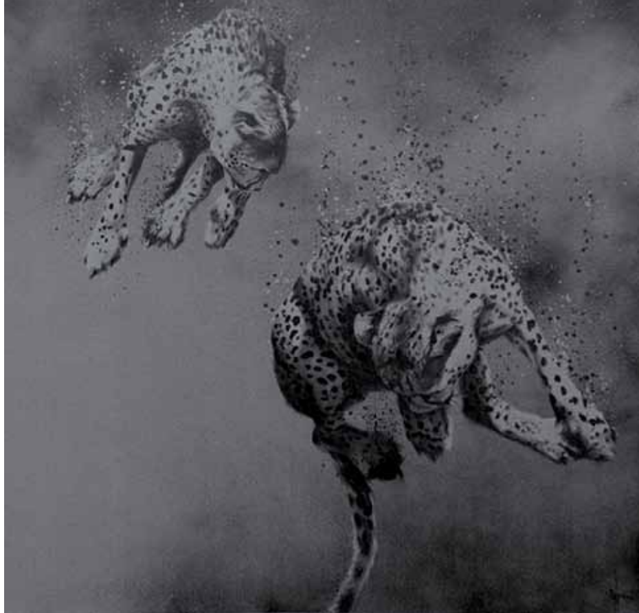
SIT, Kallenbach Gallery Haiiro Sushi Nr. 19 | 2012 Acrylic on canvas, 80 x 100 cm

Der niederländische Künstler SIT arbeitet gerade an einer neuen Kollektion, die, präsentiert von der Kallenbach Galerie aus Amsterdam, im März an der SCOPE Premiere haben wird. Das Werk Haiiro No Kaze ist ein weiterer Teil seiner Serie Haiiro , welche Szenen und Menschen ins Schwarze verschwinden, zu Leuchtflecken und Pixeln verdampfen oder eloquent als Formen vom Wind verwehen lässt. Für Haiiro No Kaze erweitert SIT sein Thema und analysiert unterschiedliche Formen und Materialien, um seine Untersuchungen des Vergänglichen vertiefen zu können. «Mein Stil ist nüchtern und rau. Ich liebe es, in meiner Arbeit mit Kontrasten zu spielen», erzählt SIT. «Die grösste Herausforderung für mich ist, in meinen Subjekten Unbehagen